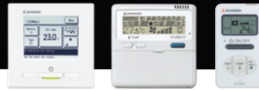
RC-EX3A RC-E5 RCH-E3 ПРОВОДНЫЕ