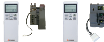
RCN-K-E2 (для FDK15-56) RCN-K71-E2 (для FDK71-90) БЕСПРОВОДНЫЕ