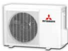
SRK20HG-S, SRK28HG-S, SRK40HG-S